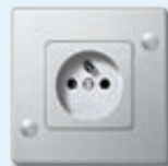
Prise de courant avec broche de terre et protection enfant