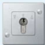
Interrupteur à serrure demi-cylindrique pour volets roulants