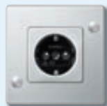
Prise SCHUKO® avec protection enfant