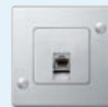
Prise de téléphone RJ45