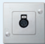
Prise femelle audio XLR