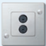
Prise de haut-parleur