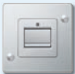
Interrupteur à bascule